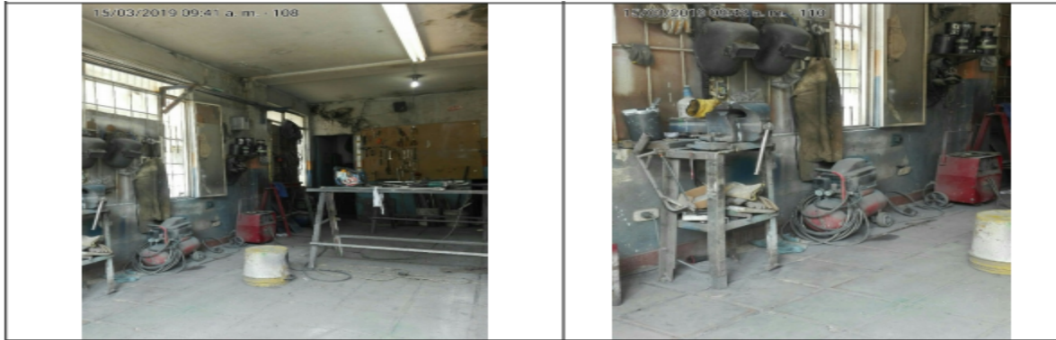
Fotografía No. 3 y 4: Áreas de corte, pulido y ensamble.