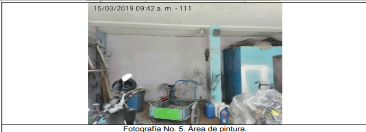
Fotografía No. 5. Área de pintura.